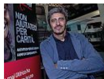
Testimonial Pif, Pierfrancesco Diliberto