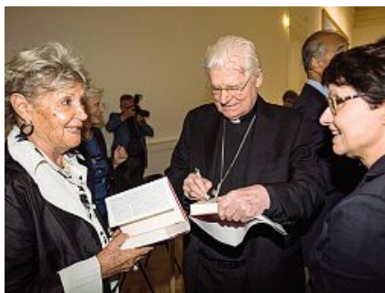
Autore Dopo il dibattito il cardinale Angelo Scola firma copie del suo libro