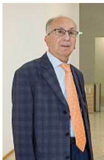
Giornalista e scrittore Luigi Geninazzi ha partecipato alla stesura dell'autobiografia