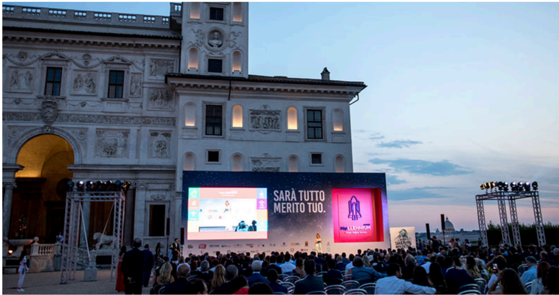
Cerimonia di premiazione 2017 | Villa Medici a Roma

In questo ambito saranno premiati i due migliori progetti presentati da street artist under 30 che avranno come tema quello dei diritti umani, nell'anno in cui si celebrano i 70 anni della Dichiarazione Universale dei Diritti dell'Uomo . Le opere vincitrici saranno realizzate nel mese di settembre 2019 e agli artisti vincitori sarà inoltre riconosciuto un premio in denaro pari a 2.000 euro per il 1° classificato e 1.000 euro per il 2° classificato.