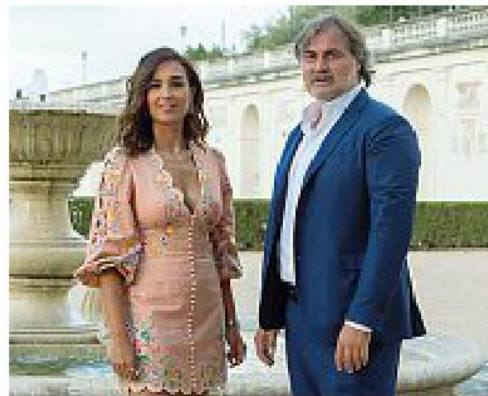
Conduttori televisivi Caterina Balivo e Pierluigi Pardo a Villa Medici