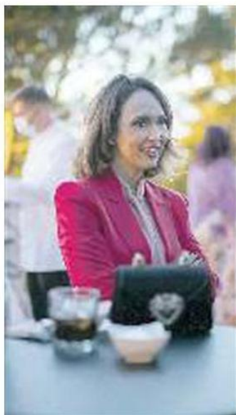
Sopra, l'attrice Chiara Francini. A destra, il regista Fausto Brizzi con la moglie Silvia Salis, vicepresidente vicario del Coni, protagonisti della serata andata in scena nei giardini di Villa Medici

Bellissima Silvia Salis , vicepresidente vicario del Coni accanto al marito regista Fausto Brizzi . Prendono posto l'attrice Chiara Francini , l'ex cestista Raffaella Masciadri e la ministra Erika Stefani . Il palco green è rivestito di prato vero, che sarà recuperato e destinato all'asilo La Tenerezza di Roma, distrutto dall'alluvione, così come i tavolini in legno che andranno al Circolo San Pietro. Le piante verranno date in beneficenza alla casa famiglia San Giovanni Paolo II. I progetti sono