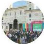
Un momento della premiazione a Villa Medici a Roma